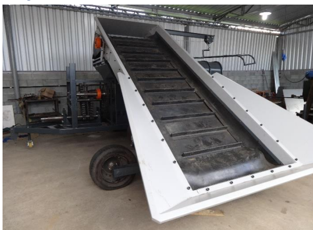
Super Silo-TUBO 3.0 Bolsas 9 pés 250 t.