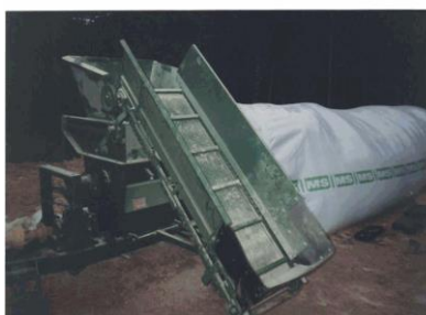
Máquina importada (1993) Tubo de 5 pés (50 t.)