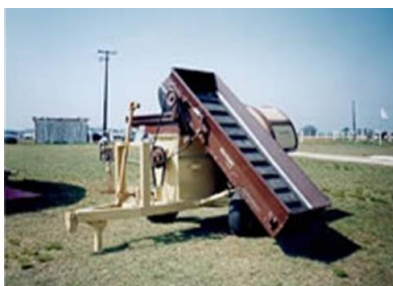
Primeira Silo-TUBO 2.0 nacional da Sinuelo, tubos 6 pés (100 t.)