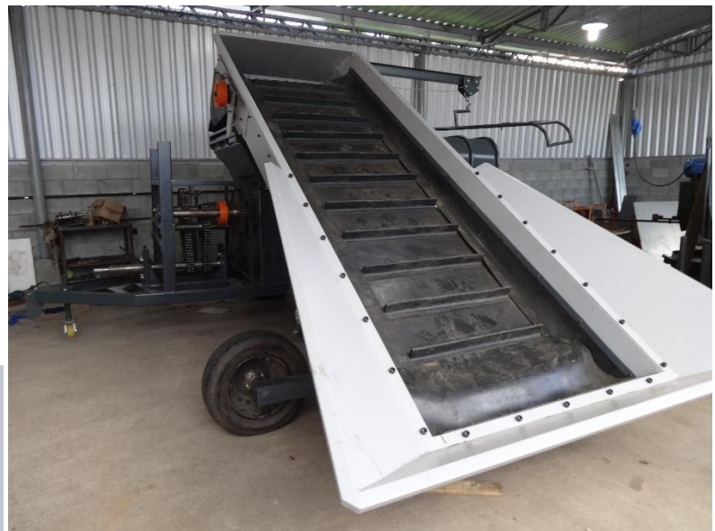
Esteira ampliada sobre rodas permite alimentação basculante (*)