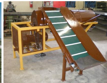
Primeira embolsadora de silagem em sacas de 50 a 200kg